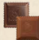
CARRÉ CROQUANT Praliné au riz soufflé