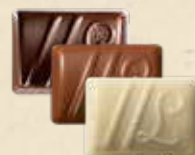
DUETTO Ganache au chocolat noir à la fraise et vinaigre balsamique ou au chocolat au lait, crème de nougat et graines de sésame ou au chocolat noir yuzu et saveur fruit du dragon

Ces chocolats ne représentent qu'une partie de notre offre.