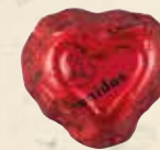
FOREVER ROUGE Chocolat au lait, praliné