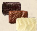
CASALEO Praliné au riz soufflé