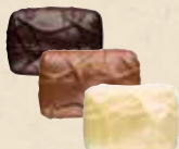
NOISETTE MASQUÉE Praliné avec une noisette entière