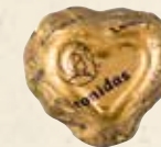
CAFÉ LAIT Chocolat au lait, crème confiseur au café