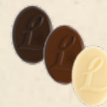
LOUISE Praliné saveur caramel, Praliné saveur caramel aux noisettes caramélisées